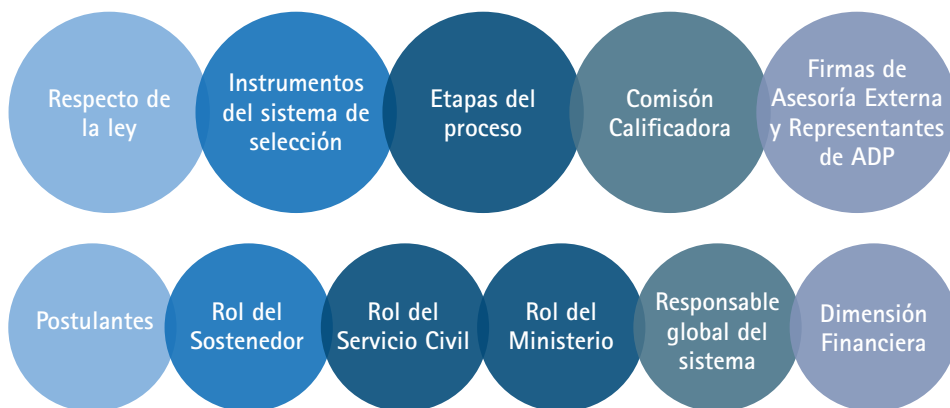
Ilustración 1. Dimensiones de estudio

La motivación de este estudio nace, en primer lugar, del reconocimiento internacional de que invertir en mejorar a los directores es más efectivo, en términos de recursos y tiempo, que invertir en otras variables del proceso educativo.